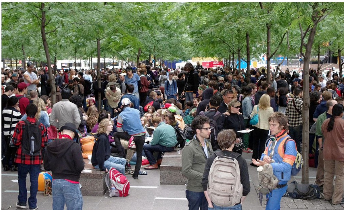
Движението „Окупирай” в Парк „Зукоти“, Ню Йорк, 2011

Движението „Окупирай” обхвана близо 1 000 града в над 80 държави през 2011г. Отчасти вдъхновено от „Арабската пролет”, където демонстраторите отказаха да се разпръснат, докато не бъдат изпълнени техните искания, активистите, младите хора и много други вдигнаха палатки и създадоха малки самодостатъчни си общности, „окупиращи” откритите пространства в центровете на градове по целия свят. Използвайки лозунга „Ние сме 99%”, те имаха за цел да изтъкнат огромното състояние, което притежават няколко души, изкривяването на демокрацията, до което води това, и несправедливостта от задълбочаването на разликите в услугите, засягащи мнозинството.